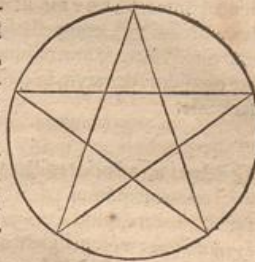
Sic Lucian pentagoni salutis symboli, cuius bi agit de quodâ, qui lapsus erat inter salutandum.

deditum rebus ex illibus his legendis occupare. Sed illud minime dissimulare possum, posse nos in verâ salutis significatum accipere quinque Christi vulnera, pectoris unum, manuum duo, totidè pedum, quæ in propatulo posita pentalpha ipsum commode constituunt : patefactis enim manibus, quæ deorsum à lateribus porrigantur, pedibusq; ipsis modicum divaricatis, puncta æquidistantia quatuor assignantur, quintum vero in ipso pectore costas inter : à quibus punctis lineæ quinque numero æquales omnes, quæ altera alterius punctis se contingant, \pi\epsilon\upsilon\tau\alpha\gamma\epsilon\theta\mu\omega\nu faciunt, duæ quippe à pectore ad utrumq; pedem duæ alteræ in chiasmi ferè modum decussatæ à dextera manu ad pedem laevum, atq; à laeva ad dexterum, quinta ab alterutra manu ad alteram. Neq; \pi\alpha\tau\epsilon\gamma\epsilon\theta\omega\nu id fuerit, si quæ