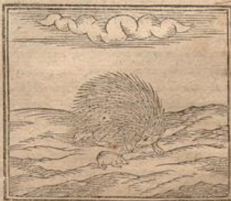
Aristot. de partibus animal. lib. 4. c. 5.

Atque hoc tam prudens alioqui animal in opportunitate captanda, & periculis evitandis ingenio & natura præmunitus, damni tamen alicujus, ob procrastinationem ingruentis, hieroglyphicum est, si illi fœtus adjicitur suus. Id enim malum ex contatione majus effectum ostendit, propterea quod alvo stimolata quamdiu potest partum differt, quo fit, ut fœtus magis inolefcens, majorem postmodum in pariundo dolorem afferat. Duo ejus genera omnino sunt, maritimum & terrestre, utrique nomen apud Græcos ἐχίνῳ. Terrestris, de quo jam diximus omnibus innotuit sub Erinacii nomine. Hujus quoque