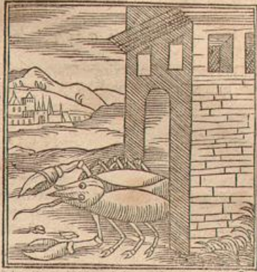
Cancer porta hominum.

C ancer, ex eorumdem Platoniorum sententia, ortum hominis vitamque notat, voluit enim animas per Canceri januam in humana corpora demitti, & ut Capricornum Deorum, sic Cancerum hominum portam vocant, quod per eam egredientes animæ humanam in naturam transeant.