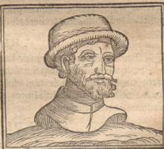
Hinc forsitan mos ut qui Magistri deoresq; titulo honorantur pileum accipiunt.

N imirum vero is apud Graecos nobilitatis indicium fuit, hique ea de causa Ulyssis caput pileatum fieri solitum. autumant, quod magna scilicet ab utroque parente nobilitas illi obtigisset. Nam apud Ovidium eam ita in Ajacem oggerit: