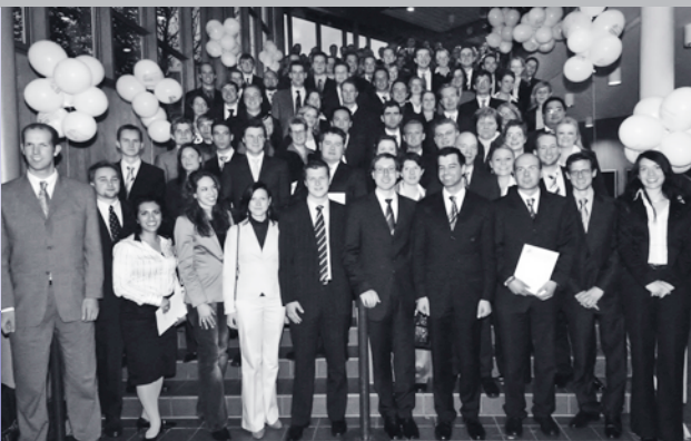
Oben: Absolventinnen und Absolventen am „Tag der Wirtschaftswissenschaften“ 2006

FAKULTÄT FÜR WIRTSCHAFTSWISSENSCHAFTEN FACULTY OF BUSINESS ADMINISTRATION AND ECONOMICS EVENTS