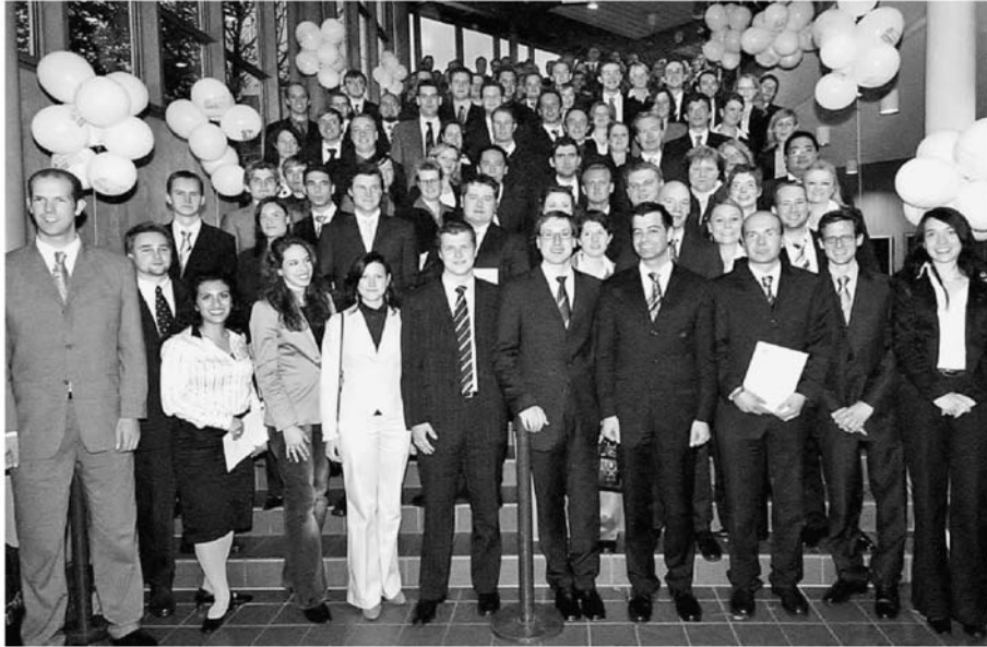
Uniade: Die Absolventen und Promovierten der Fakultät für Wirtschaftswissenschaften bekamen ihre Urkunden.