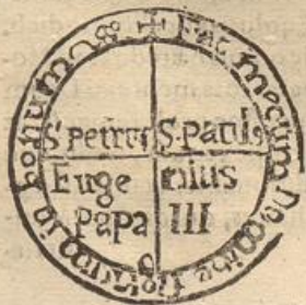
Metrop. Salzb. Tom. III.

Ego Eugenius Catholica Ecclesiæ Episcopus ss.