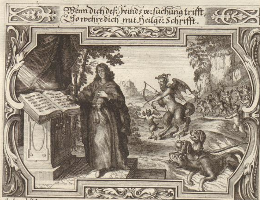
G. Strauch del.

Das Evangelium stehet geschrieben / bei dem Evangelisten Matthæo im 4. Cap. vom 4. bis an den 11. Vers. Marco im 1. Cap. Vers 13. Lucam 4. Cap. Vers 1. --- 13.