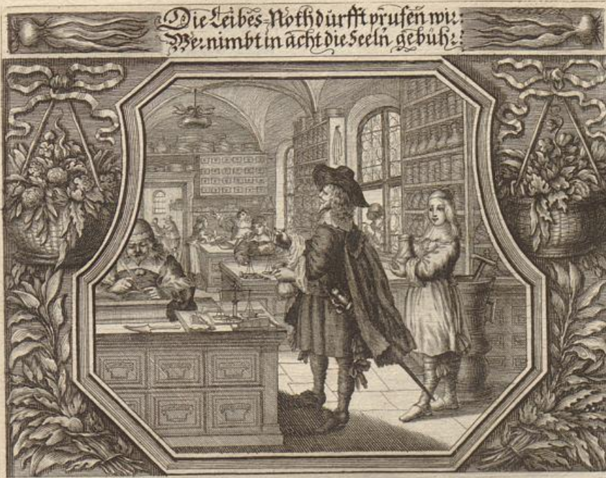
Die Leibes-Nothdürfft prüfen wir: Wennimbt in acht die Seeln gebüh:

Solche wird beschrieben/von dem heiligen Apostel Paulo/an die Philipper / im 1. Cap. Vers. 3. - 11.