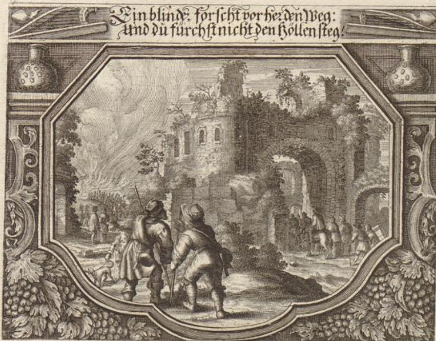
Georg Strauch Del.

Solche wird beschrieben / von dem heiligen Apostel Paulo / an die Epheser / im 5. Cap. Vers 15. — 21.