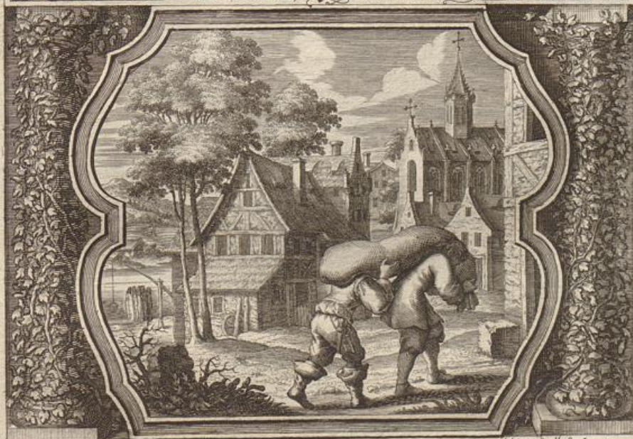
Georg Strauch del.

Trage mit der Nächsten Bürd: Wenn er sehr getrücket wird.