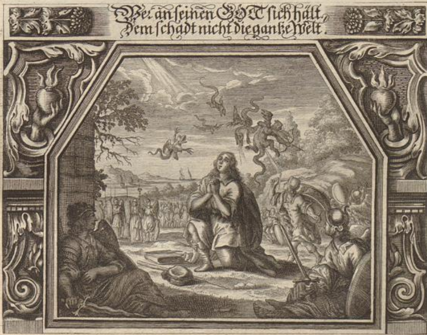
Grego Stranck Del.

Solche wird beschrieben/ von dem heiligen Apostel Petro/ in seiner 1. Epistel/ im 3. Cap. Vers 8.-- 15.