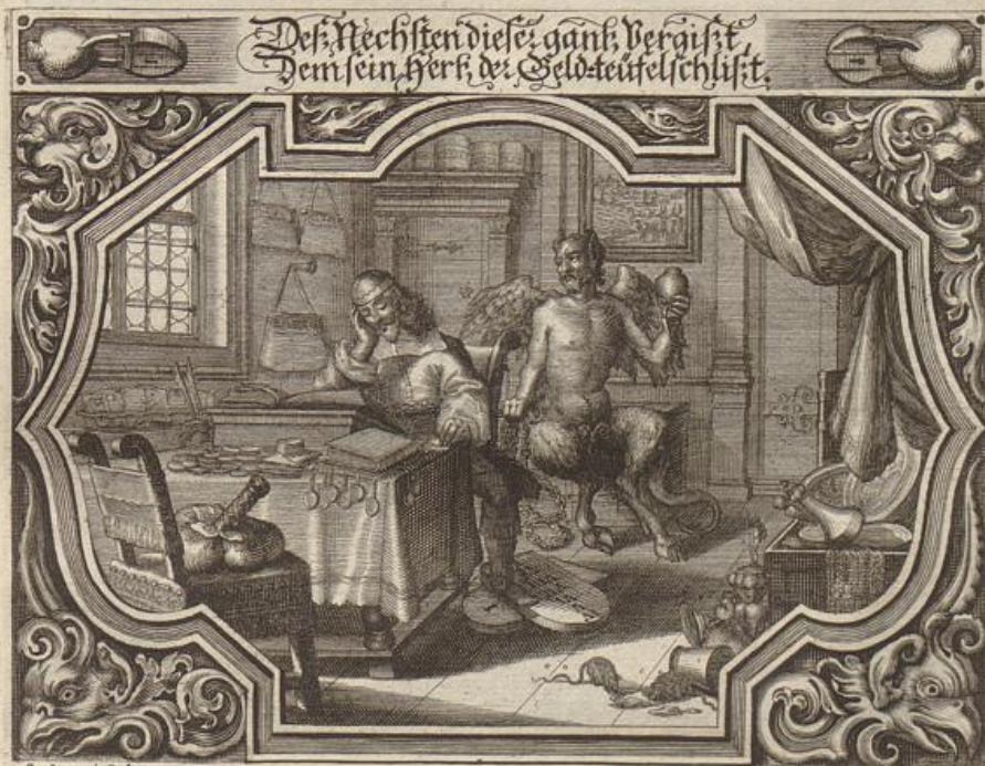
G. Strauch del.

Solche wird beschrieben/ von dem heiligen Apostel und Evangelisten Johanne / in seiner 1. Epistel/ im 3. Cap. Vers. 13. - 18.