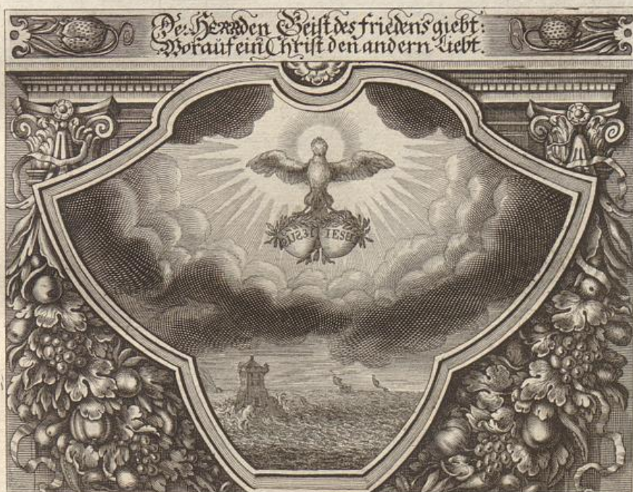
G. Strauch del.

Solche wird beschrieben von dem heiligen Apostel Paulo/ an die Philipper im 4. Cap. vom 4. bis an den 8. Vers.