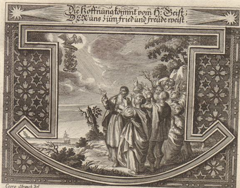
Georg Strach Del.

Solche wird beschrieben von dem heiligen Apostel Paulo an die Römer im 15. Cap. vondem 4. bis an 14. Vers.