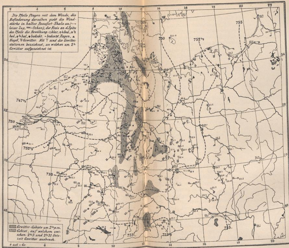
Fig. 27. Isobaren im Gewittergebiet vom 9. August 1881.