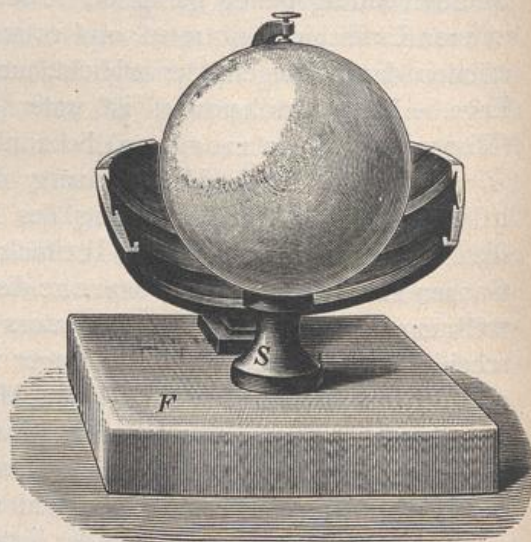
Fig. 12. Sonnenscheinautograph.

Jahreszeiten an verschiedenen Orten mannigfache verschiedene Bewölkungsverhältnisse bringen. In Europa sind die Wintermonate die wolkenreichsten, die Sommermonate haben mehr klaren Himmel.