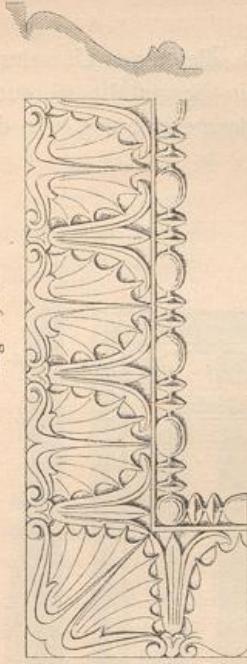
Wellenkante an der Thür des Erechtheions.