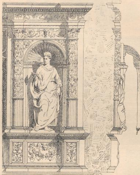
Figurennische an einem Grabmal in der Kirche Santa Maria del Popolo zu Rom.