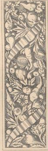
Fries an einem Hause zu Chartres.