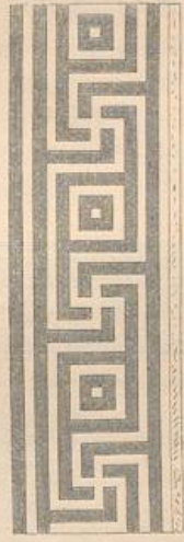
Mäander an einem Hause zu Chartres.