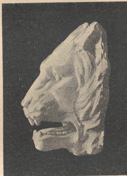
Löwenkopf von einem Sarkophag mit bacchischem Relief im Vatican zu Rom.

die hierfür angewendeten Werkzeuge für die Formengebung bestimmend. Die stoffliche Beschaffenheit des Materials, sei dasselbe Holz, Thon oder Metall, bedingt meistens eine Vereinfachung der Naturformen, ein Weglassen der kleinsten Details und eine den Werkzeugen entsprechende flächige Behandlung (Fig. 35). Durch diese Behandlungsweise erhalten die Naturformen eine eigenartige Umgestaltung, die man als Stilifirung zu bezeichnen pflegt. In solcher Weise ergibt sich trotz der Verschiedenheit des Ursprunges eine Aehnlichkeit in der äußeren Erscheinung der Formen, wodurch sie zugleich mit den übrigen Formen des Gegenstandes in Einklang treten, so zu sagen mit denselben von gleicher Beschaffenheit werden.