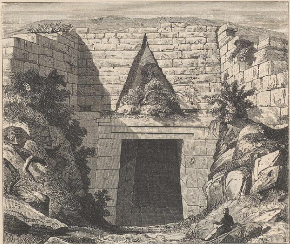
Thorbildung mit Entlastungsdreieck.

Aus diesem anfänglich regellosen Getüge entwickelte sich bei den späteren Bauten nach und nach durch Bearbeitung der Stoss- und Vorderflächen der Steine ein eigenthümliches netzförmiges System des Fugenschnittes.