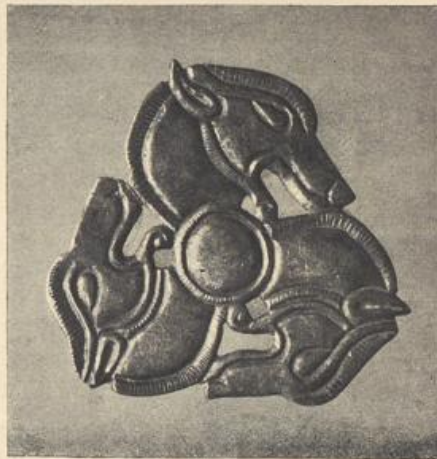
Skuthische Silberbleche des 4. Jahrh. v. Chr. aus dem Sunde von Craiova, Rumänien. Berl. Museum. \frac{1}{1} .