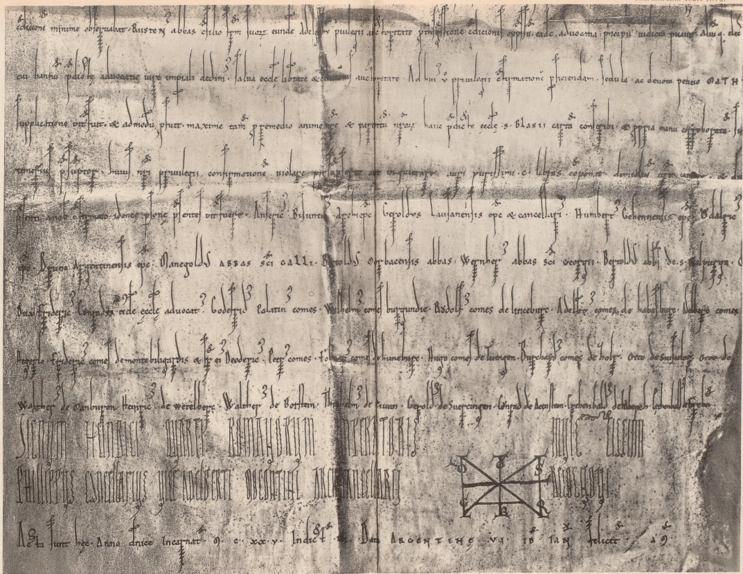
Die Signum- und Rekognitionszeile von Philippus B in dem Diplom Heinrichs V. für St. Blasien (St. 3204). BRACKMANN: Zur Geschichte der Hirsauer Reformbewegung im XII. Jahrhundert. — Taf. VI.