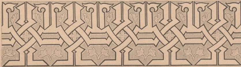
Deckenmalerei in der Palatinischen Kapelle in Palermo.