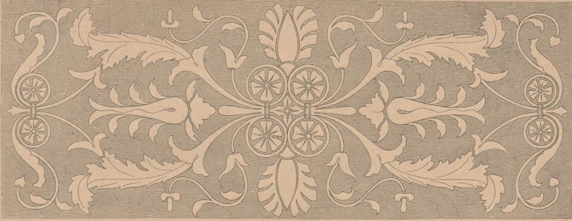
Intarsia von den Chorstühlen in Sta. Maria in Organo zu Verona (1499).