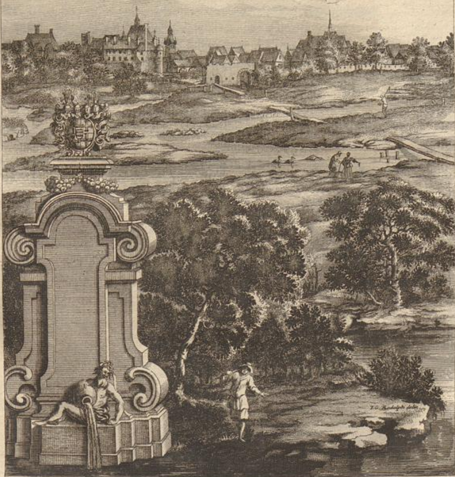
Lappirino seu Lappie fontes, Romanorum liberis, et Francorum comitibus clari.

atque anu, rum, om.2. ditus rtatis rtum llum c.c. diam Tac. um, essa- qua- re- esta- ccu- Hor- quo- leræ hoc sco- o ON-