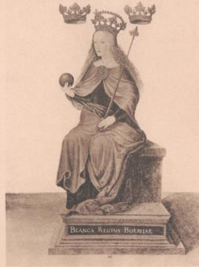
ALLE RECHTE VORBEHALTEN