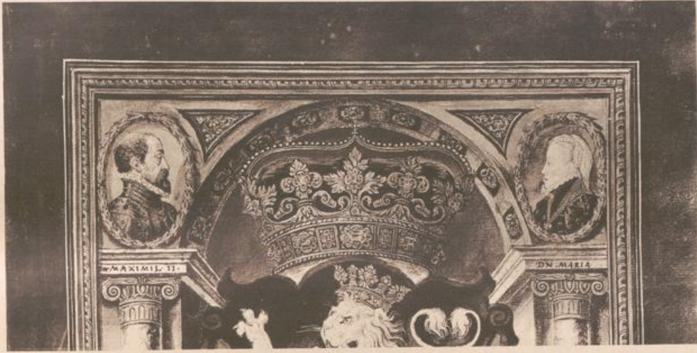
Abb. 1. Die Bildnisse Maximilians II. und seiner Gemahlin Maria. Wien, k. u. k. Hofbibliothek Hs. Nr. 8330, Bl. 65.