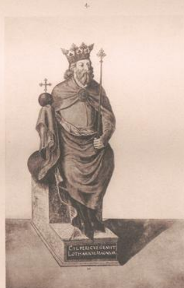
PHOTOYYP. VON CARL BELLMANN, PRAG.