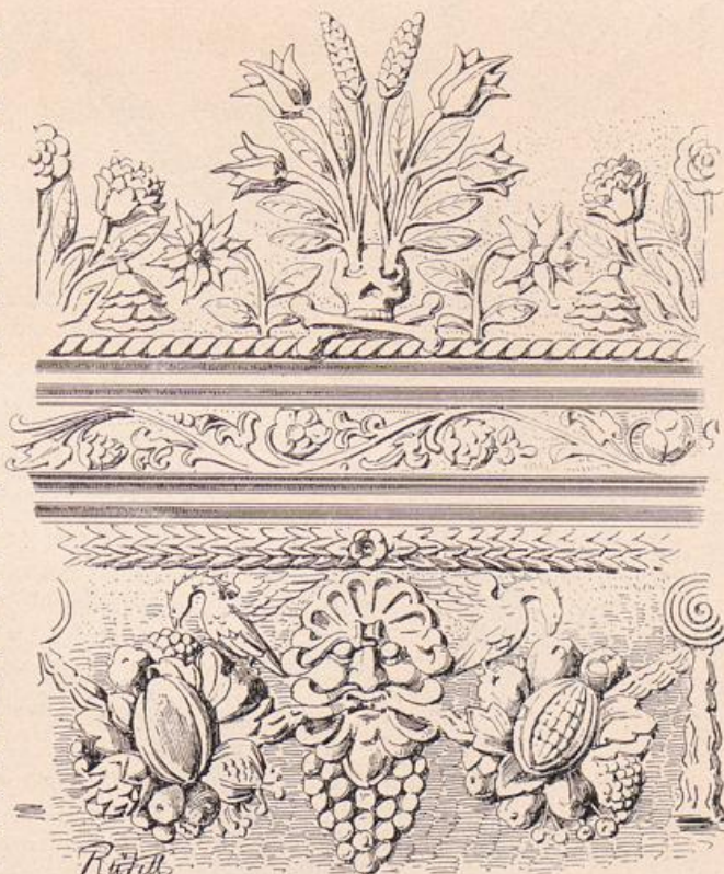
Abb. 229. Domkirche. Verzierung der Glocke von 1679 (nach Bergau, Fig. 58).

Im westlichen, durch eine Wand abgetrennten Teile der Krypta befinden sich dreizehn Särge. Unter ihnen ist ein Zinnsarg vom Anfange des 18. Jahrhunderts; die zwölf anderen sind profilierte Eichenholzsärge mit verzinntem Schmiedeeisenbeschlag in Nofokoformen. Von diesen zeichnet sich ein reicher ausgestatteter durch hübsches Rankenwerk und Blumengirlanden aus. Er birgt die Leiche des 1772 verstorbenen Sigismund Bogislav Friedrich Ernst v. Kleist, der das Ritterkolleg zu Brandenburg besuchte und im Alter von 17 Jahren starb.