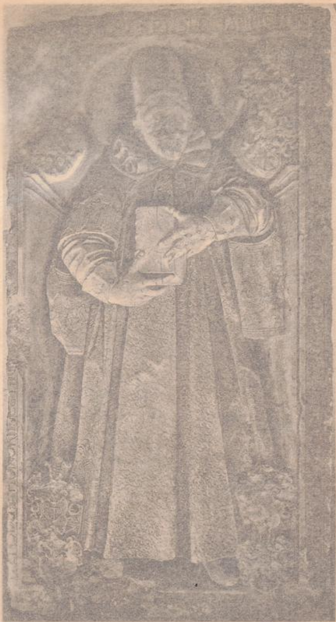
Domkirche. Grabstein des Dechanten von Königsmarkt.