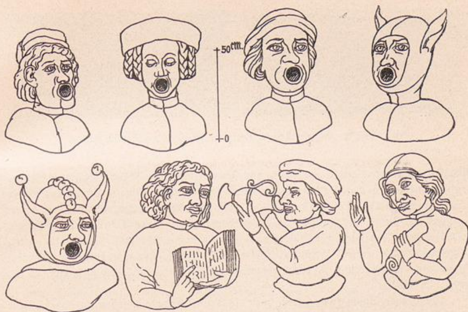
Abb. 218. Domkirche. Gemalte Köpfe an den Rippen des Chorgewölbes.

Grabsteine aus mehreren gebrannten Tonplatten. Im Fußboden des südlichen Kreuzarmes liegen etwa sieben, die meist unvollständig sind und zum Teil die Figur des Verstorbenen in ausgegründetem Flachrelief, aus drei bis vier Platten zusammengesetzt, zeigen (siehe Vergau, Fig. 63). Die Umschriften mit vertieften Buchstaben sind aus Backstein gebildet. Von den Grabsteinen ohne Figur sind die beiden folgenden am besten erhalten: