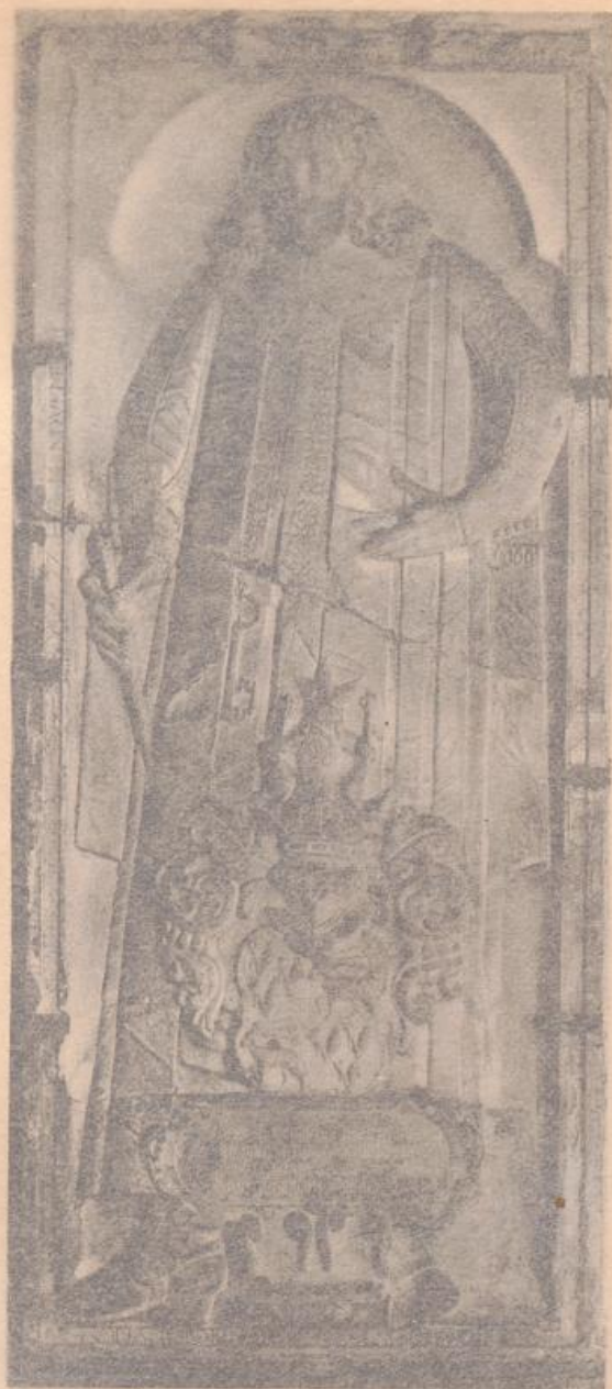
Domkirche. Grabstein des Propstes Werner von der Schulenburg.