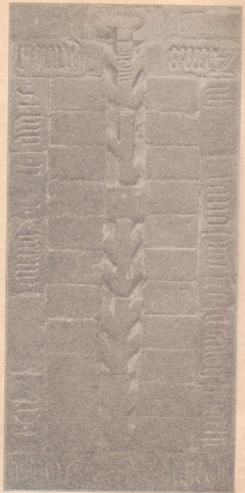
Abb. 216. Domkirche. Grabstein des Joachim Vniel.