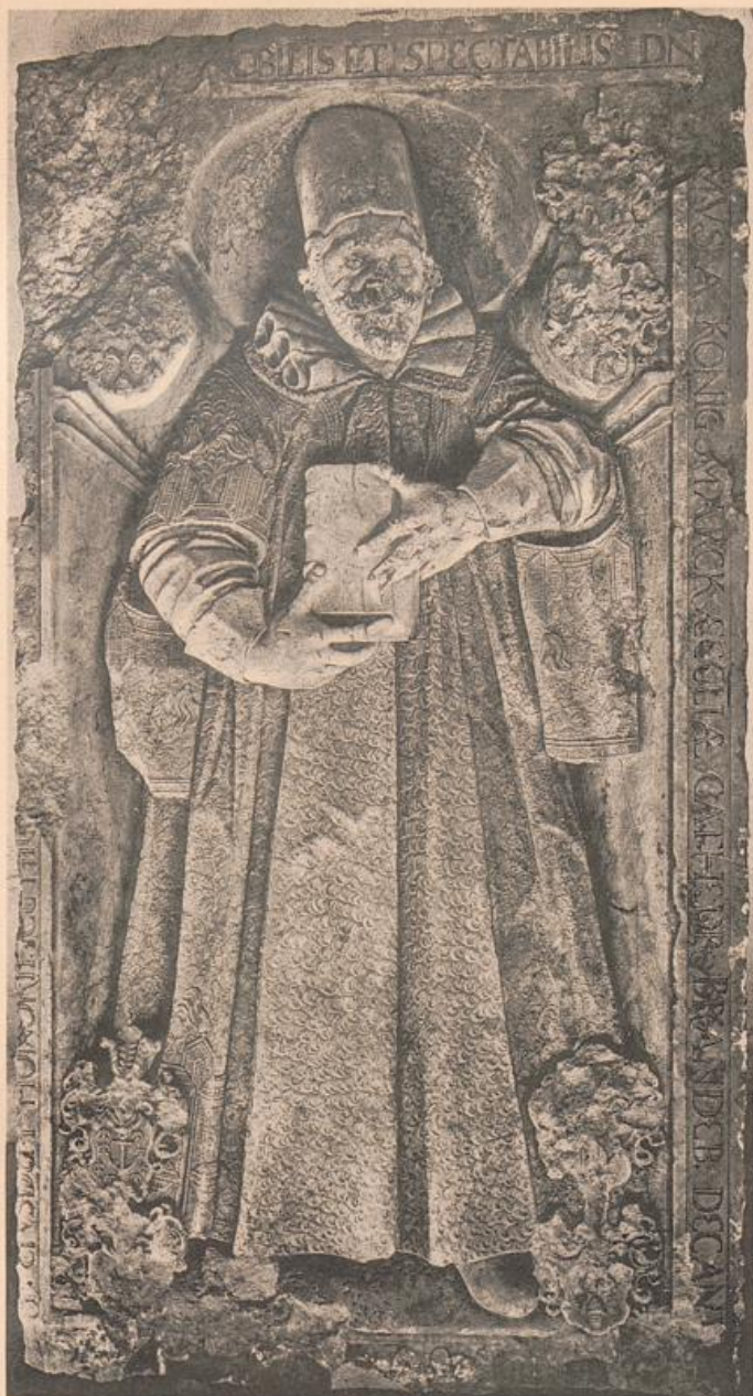
Domkirche. Grabstein des Dechanten von Königsmarck.