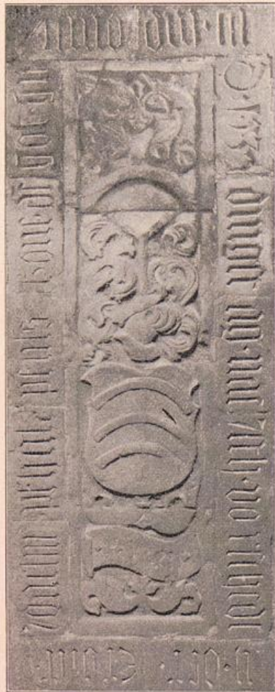
Abb. 216. Domkirche. Grabstein des Joachim Vuel.