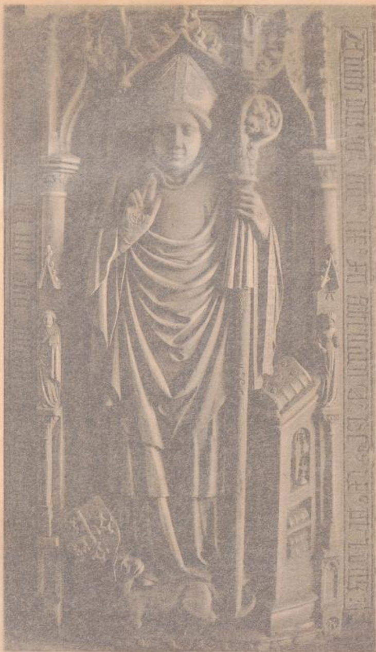
Domkirche. Grabstein des Bischofs Stephan Bötticher.