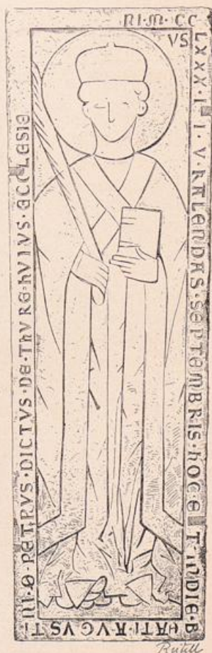
Abb. 213. Domkirche. Grabstein des Kanonikus Peter von Thure (nach Bergau, Fig. 59).

11. Der Konverse Heinrich Briße, † nach 1380 (Abb. 215). Die Figur in Laientracht, ohne Kopf-