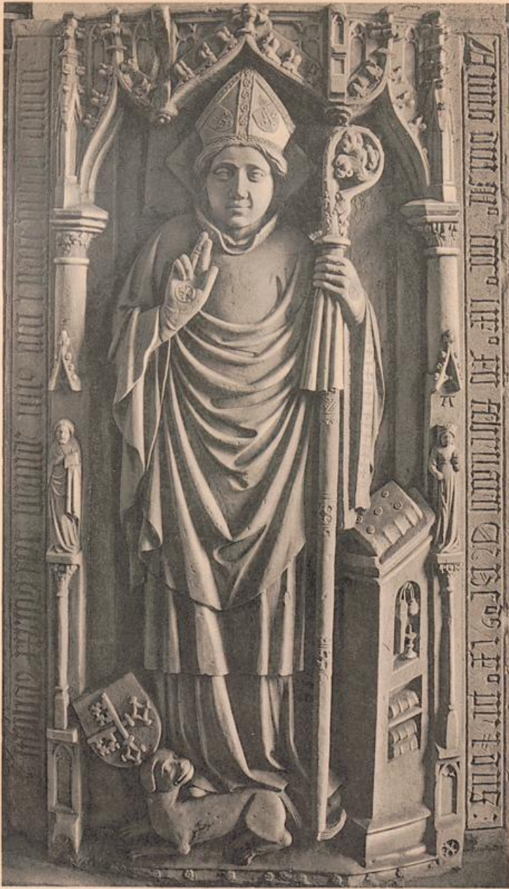
Domkirche. Grabstein des Bischofs Stephan Bötticher.