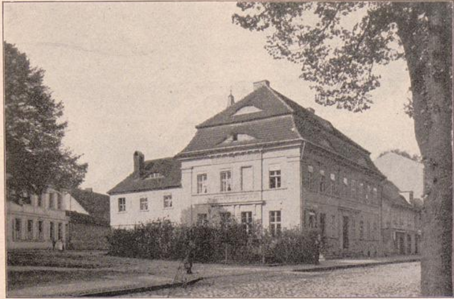
Abb. 263. Eckhaus am Domkies.

anderer Richtung mit Schild und Speer; 6) eine Chimäre mit Menschenkopf, Löwenleib, zwei Pferdefüßen und Flügeln; 7) eine ähnliche Chimäre in entgegengesetzter Richtung. Die achte Schildform hat 3,6 cm Durchmesser und zeigt einen heraldischen Adler der älteren Form mit erhobenem Kopfe. Zwei Bügel der Glockenkrone sind abgebrochen.