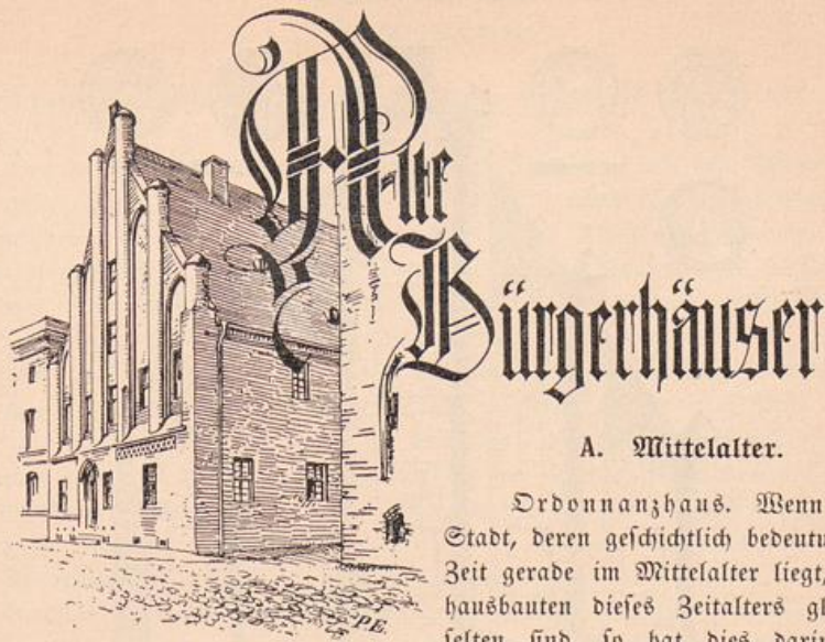
Abb. 103. Steinhau der Altstadt.