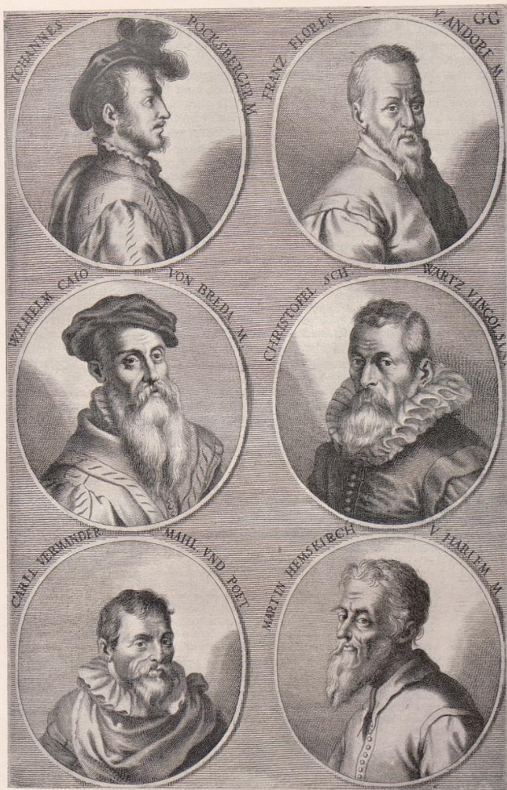
Hans Bocksberger. Wilhelm Key. K. van Mander.