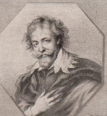
PETRVS PAVLVS RYBBENS.

A. van Noort. Guido Reni. Abraham Bloemaert.