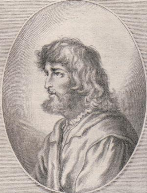
SIGMUND HOLBEIN MAHLER ZU AUGSPURG.