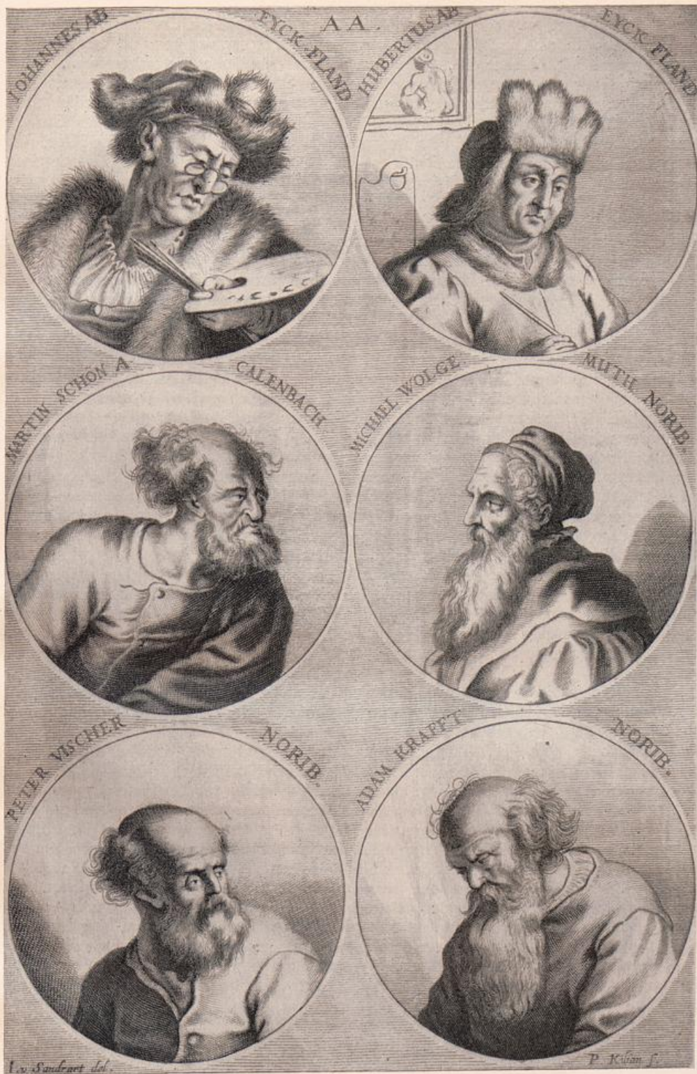
Jan van Eyck. Martin Schongauer. Peter Vischer.