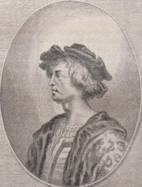
NICOLAUS MANUEL MAHLER ZU BERN.