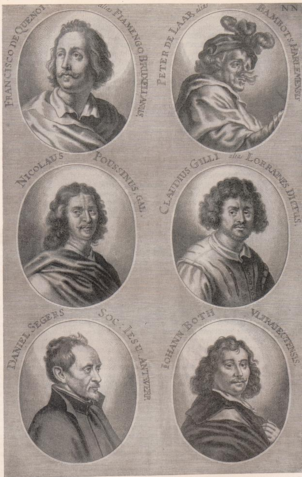
Frans Duquesnoy. Nic. Poussin. Seghers.