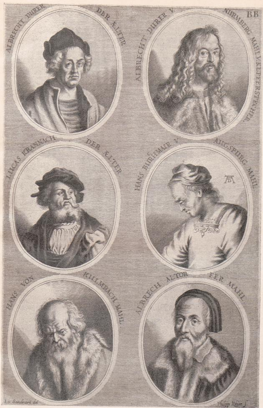
A. Dürer d. Ae. Lukas Cranach. H. v. Kulmbach.