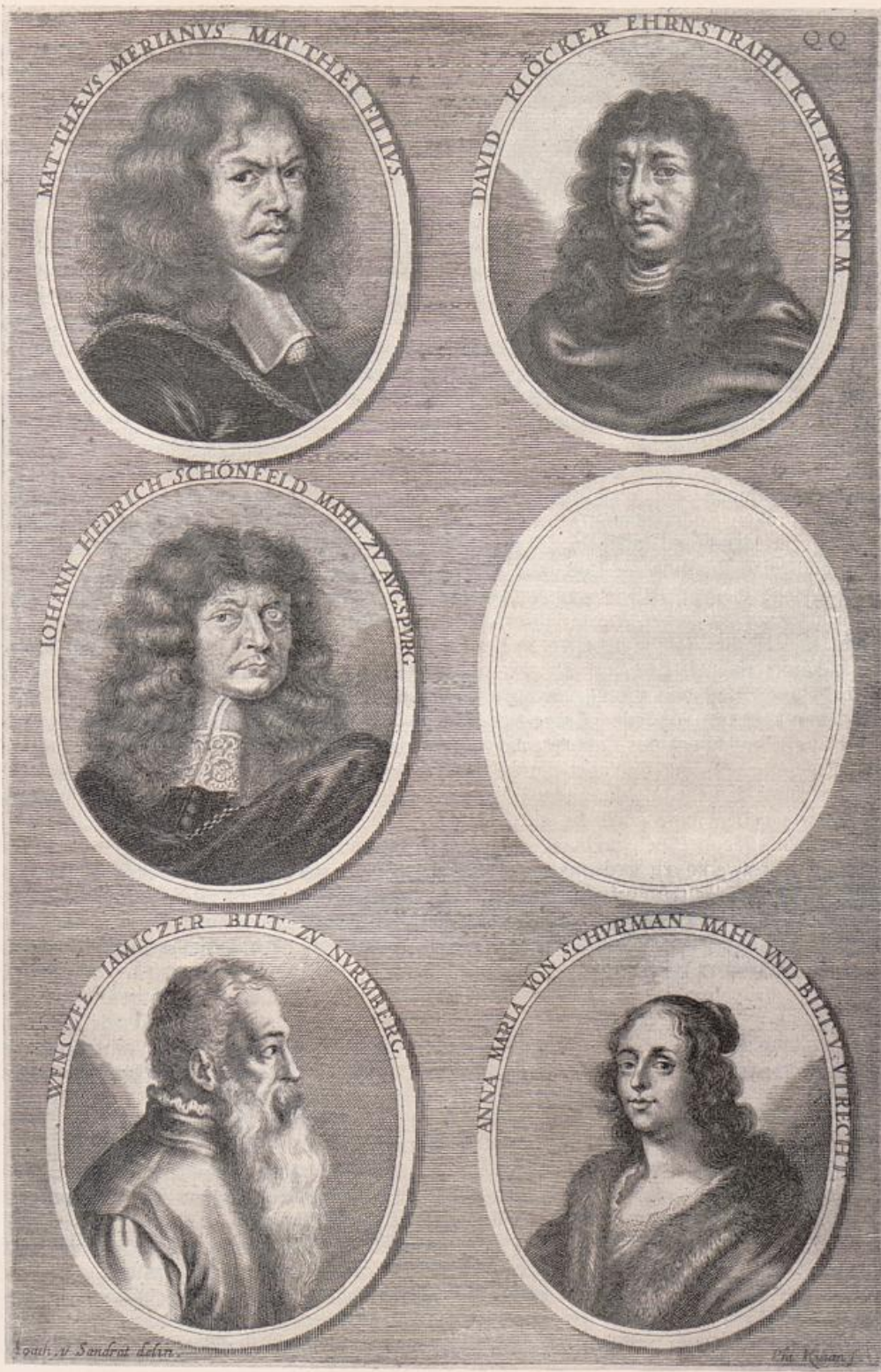
Matthäus Merian d. J. J. H. Schönfeld. Wenzel Jamnitzer.