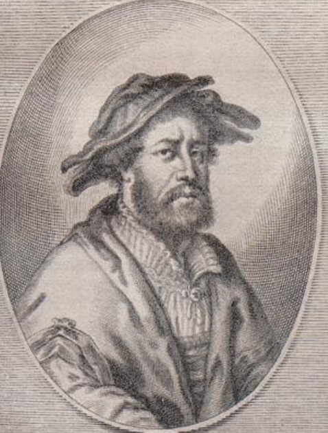
HANS HOLBEIN DER JÜNGER MAHLER ZU BASEL.