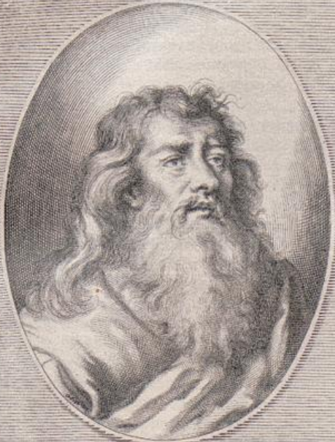
HANS HOLBEIN DER ÄLTER MAHLER ZU AUGSPURG.