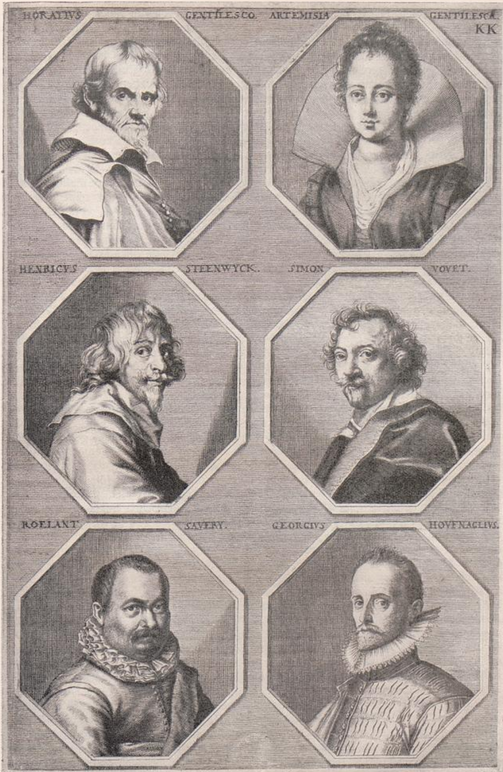
Orazio Gentileschi. H. v. Steenwyck d. J. Roelant Savery.