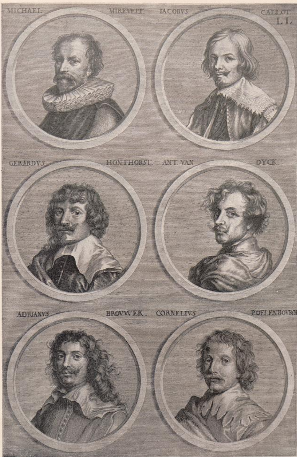
Mirevelt. G. Honthorst. Brouwer.