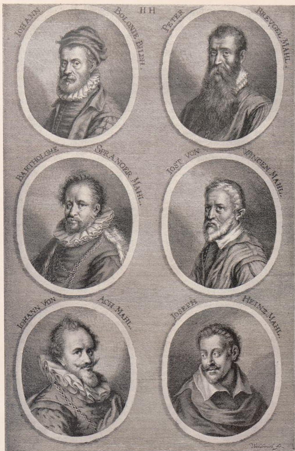
Giovanni da Bologna. B. Spranger. H. v. Aachen.