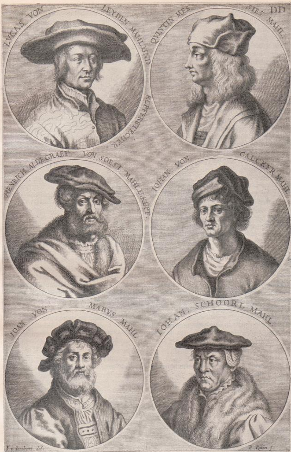
Lukas van Leyden. Aldegrever. Gossaert-Mabuse.