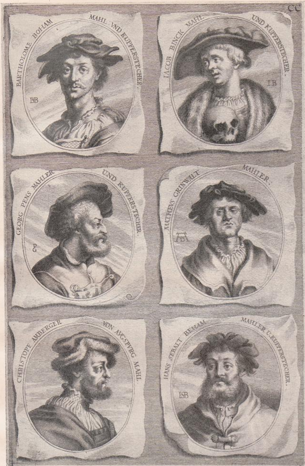
B. Beham. Penz. Amberger.