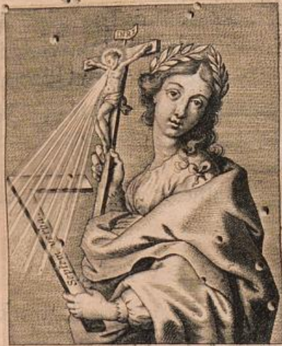
Secundum mensuram regule Patientia Septem verba Christi morientis.

E XTREMA verba, quæ languentes & morientes locuti sunt viri sancti in omnibus & singulis imaginibus Sanctuarij, oracula sunt languentibus ac morientibus; septem autem verba, quæ affixus crucis lecto Rex gloriosus pronuntiauit, sacratiora sunt oracula, quæ perfecta ac coronata Patientia sacra Deo ex ore Crucifixi excipit, & excipere in extremis homines patientes docet. Septem sunt verba secundum mensuram regule , cuius vel ipsa figura septenarium numerum 2. Cor. 10, 17. M m m m 2 rum