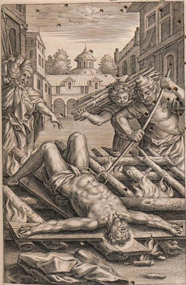
Smyrna fuit quondam Plutoni \sigma\upsilon\upsilon\sigma\upsilon\upsilon\alpha : sed ecce 32. Oblita Pionij sanguine \sigma\upsilon\upsilon\sigma\upsilon\upsilon\alpha Deo est.