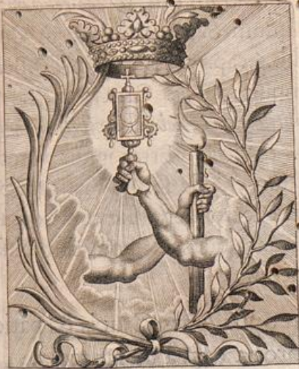
Fax, hostia, corona Subditi, leuamini's, honoris.