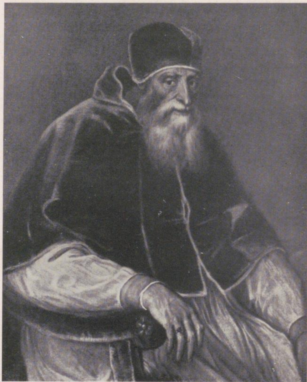
Papst Paul III.