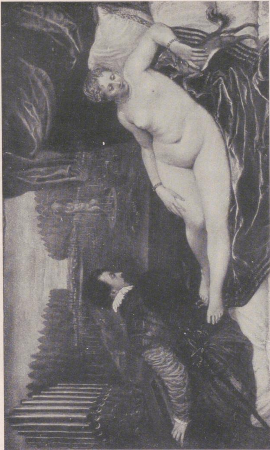
Venus mit dem Orgelspieler