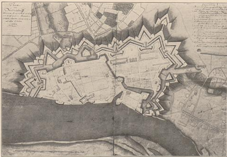
Abb. 26. Düsseldorf. Stadtplan vom Jahre 1764. Vgl. Abb. 24.