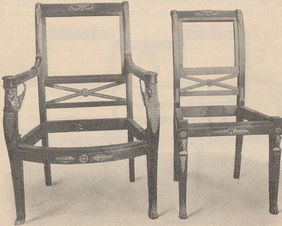
Sessel und Stuhlgestell, Empire, Mahagoni mit Bronzen. Originale im Museum zu Versailles.

Mit dem Sturze Napoleons und der Wiedereinsetzung der Bourbonen (1815) war es auch mit der Begeisterung für das Empire vorbei. In dem sogenannten Restaurationsstil , der in Frankreich an seine Stelle trat, lebten jedoch immer noch antike Elemente fort, und auch in anderen Ländern zeigte der fernere Geschmack des 19. Jahrhunderts Erinnerungen an die klassische Formensprache; nur daß die Ausdrucksweise der früheren Einheitlichkeit entbehrte: sie erscheint je nach den politischen Verhältnissen und geistigen Zeitrichtungen der einzelnen Völker verschieden ausgebildet. Man war vielfach bestrebt, den künstlerischen