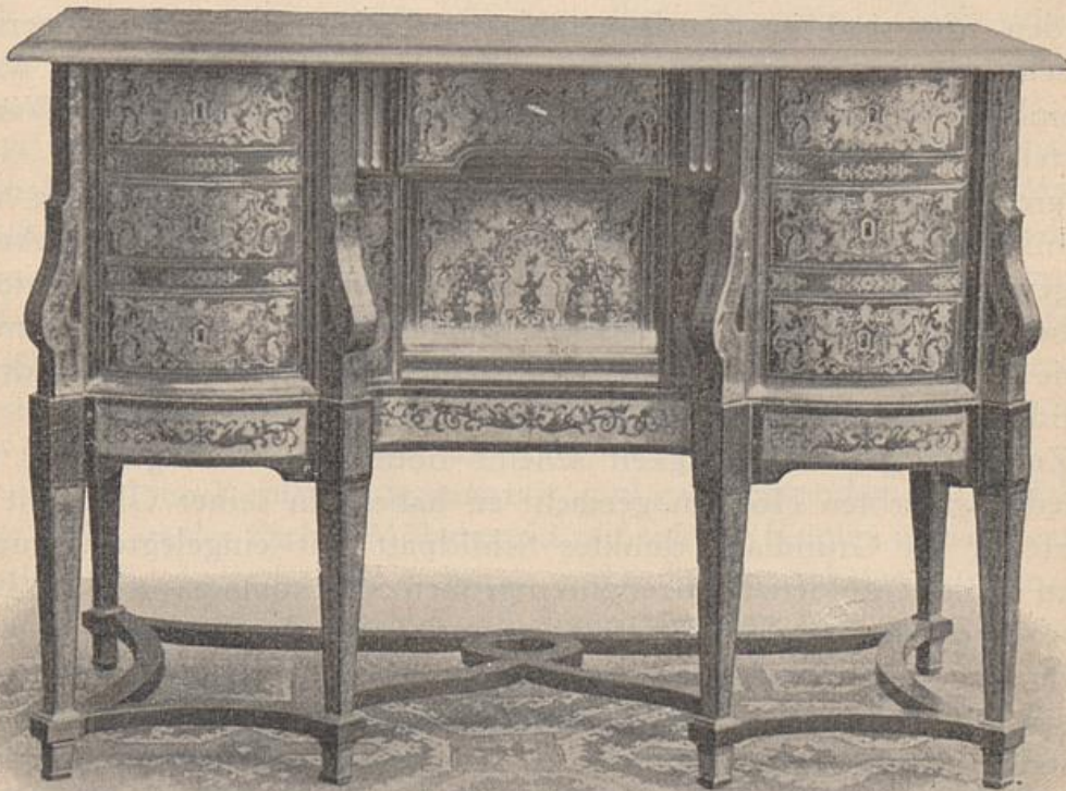
Schreibtisch, feine alte Boulle-Arbeit.

und Graveur; aber alle die anderen Eigenschaften, die er in seiner Person vereinigte, sind an seiner Neuerung im Fache der Möbeltischlerei ersichtlich. Streng architektonisch ist der stets solide Aufbau, ist die Konstruktion seiner Möbel; er weiß die Massen kräftig auseinanderzuhalten und sie mit funktioneller Bedeutsamkeit zu gliedern. Malerisch ist der Charakter seiner Schmuckformen im Großen wie im Kleinen; durch wohl abgewogene Übergänge löst und verbindet er kräftige Kontraste, offenbart in der sorgfältigsten Zusammenstellung der Materialien, die er für seine eingelegten Arbeiten verwandte, das feinste Verständnis für kolo-