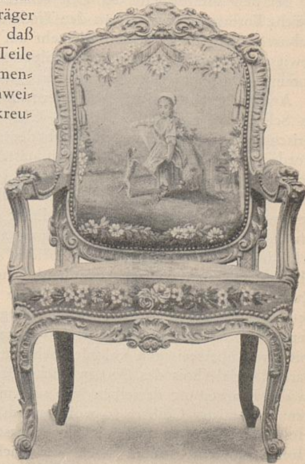
Louis XIV.-Sessel, holzgeschnitzt und echt vergoldet, mit feinen alten Aubusson-Taschen.