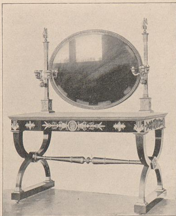
Abb. 140. Empire-Toilettentisch von Jacob Desmaller. (Nach: Portef. des Arts décor.)

An Stelle der Bronze-Auflagen, die keinerlei struktiven Sinn, wie Scharniere,