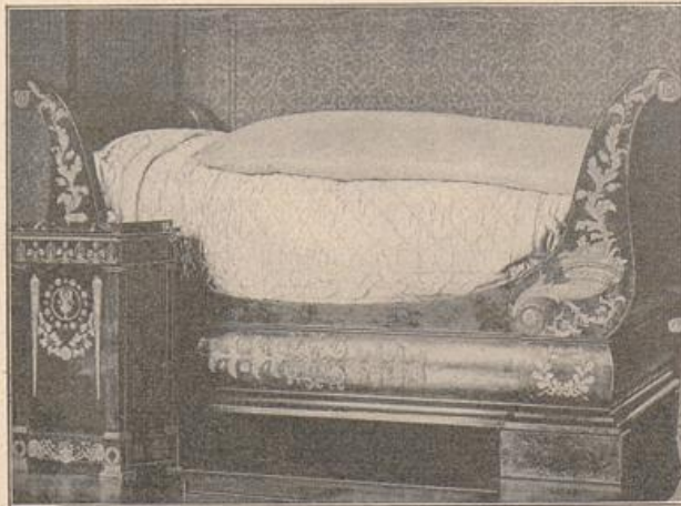
Abb. 141. Empire-Möbelgruppe aus dem kgl. Schlosse Wilhelmshöhe.