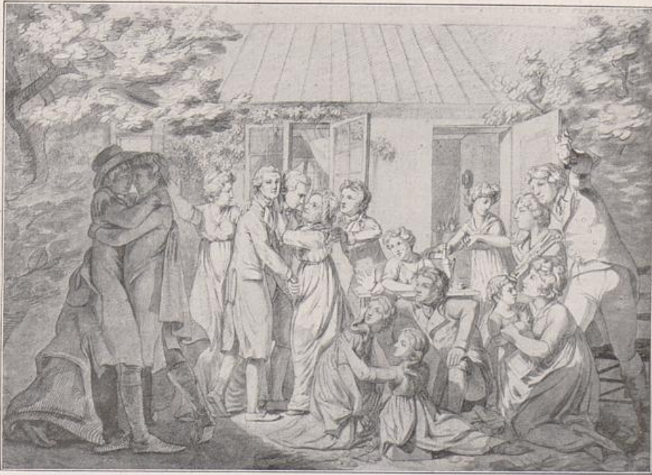
Abb. 15. Philipp Otto Runge, Die Heimkehr, Handzeichnung

grunde des Interesses dieser Künstler wie bei Runge. Hier mochte die Vorherrschaft des klassizistischen Porträts unerschütterlich sein. Géricault und Delacroix sahen die Möglichkeit zu einer neuen, wenn man so will romantischen Bildform auf anderen Gebieten, und ihre malerische Phantasie drängte instinktiv zu dem artistisch moderneren Programm, dem Programm von Licht, Luft und bewegendem Leben. Géricault, der Vorläufer der Bewegung, Delacroix, das umfassende Genie der Romantik, und Daumier, der Einsame, dem die Zukunft gehörte, haben nur gelegentlich Bildnisse gemalt, nie auf Bestellung, sondern immer nur aus innerem Drang, um ein Erlebnis loszuwerden. Ob es nur ein Zufall ist, daß die beiden bedeutendsten Porträts, die Delacroix und Daumier malten, Musiker darstellen? Ob nicht vielmehr das innerlich musikalische Element, das aller romantischen Kunst, als einer Gefühls- und Empfindungskunst, irgendwie zugrunde liegt, hier unbewußt nach