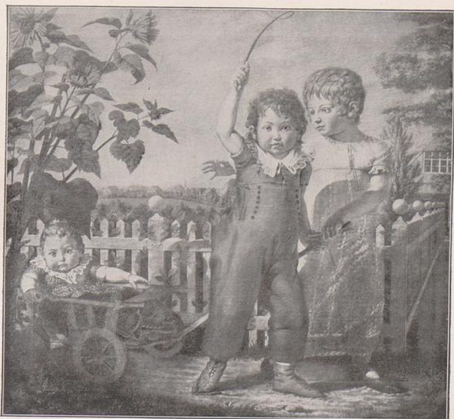
Abb. 14. Philipp Otto Runge, Die Hülsenbeckschen Kinder

zum geringsten auf dem plastischen Aufbau der Gruppe. Die wundervolle Geschlossenheit der Silhouette im ganzen und im einzelnen, das Verhältnis der Köpfe zueinander, mit der leisen Verschiebung ihrer Achsen und der feinen Drehung ihrer Massen, rhythmisch abgewogen und ausgeglichen wie Musik, diese Formenverhältnisse tragen den Charakter von Notwendigkeit und Größe und beruhigen die mächtige Empfindung, ebenso wie die stille Führung des reichen Lichtes. Und damit im Zusammenhang nun die Landschaft! Keine Kulisse mehr wie bei den Engländern, keine malerisch dekorative Andeutung, sondern Realität und Dasein überall, ein schwellender, von feinstem Formenleben erfüllter Raum, von tragender, geheimnisvoller Stimmung in Licht und dunkler Farbe.