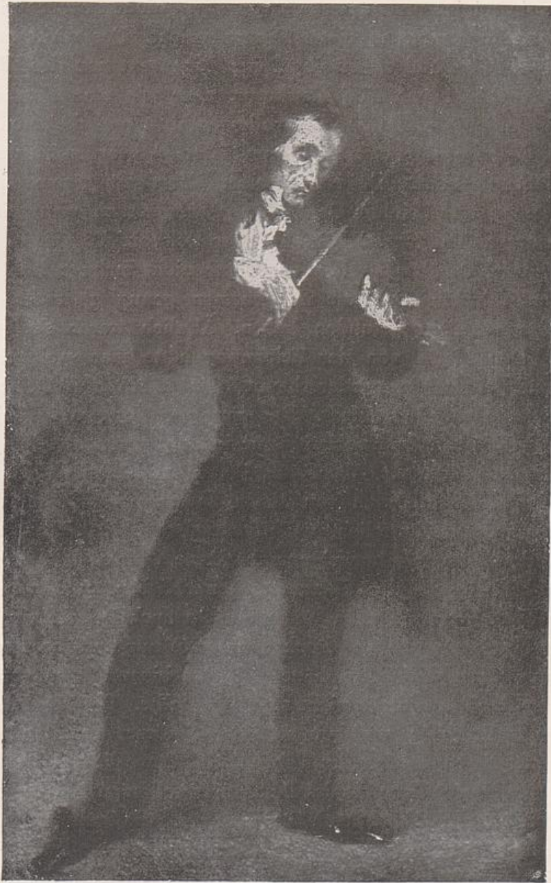
Abb. 16. Eugène Delacroix, Paganini