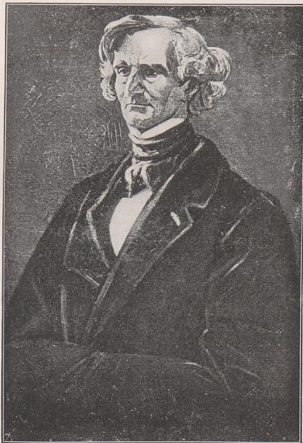
Abb. 18. Honoré Daumier, Hector Berlioz