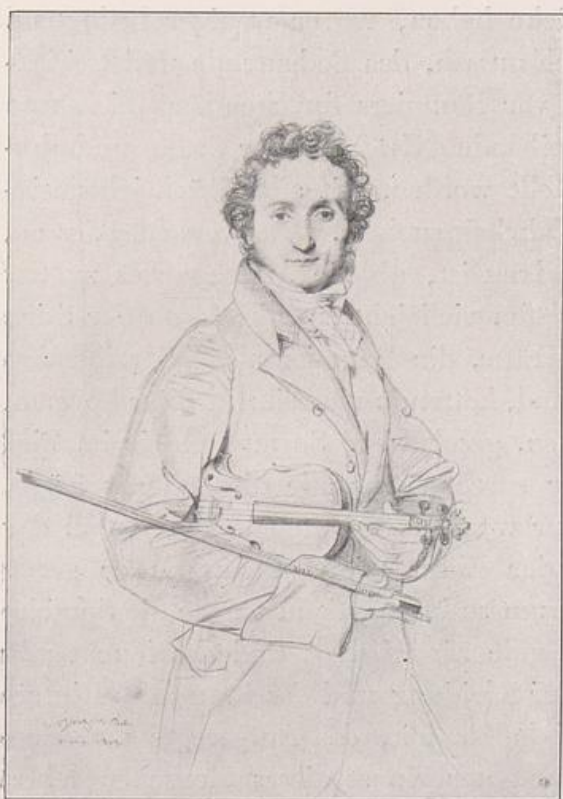
Abb. 17. Ingres, Paganini, Zeichnung

wühlter Flächen aut. Nirgend setzt eine Form mit scharfem Kontur gegen die Nachbarform ab, selbst der Nasenrücken mit seinen Kanten lebt nur durch offen gegeneinanderstehende Flächen. Aber weil Daumier die Form von innen heraus beherrschte, konnte er auf die sorgsam rundende Modellierung verzichten und mit erregten Andeutungen alles sagen, was er sagen wollte, und wir sind gewiß, daß nur dadurch die glühende Lebendigkeit, das Geniale und das Dämonische, das in diesem Berlioz rumorte, in Erscheinung treten konnte. Drohend wirkt dieses Antlitz und diese Gestalt, voll von tobenden Kontrasten und doch einheitlich. Daumier übertreibt immer, aber er übertreibt von seinem Gefühl aus. Er weiß, was wirkt, was den Gesamteindruck bestimmt. Mochte