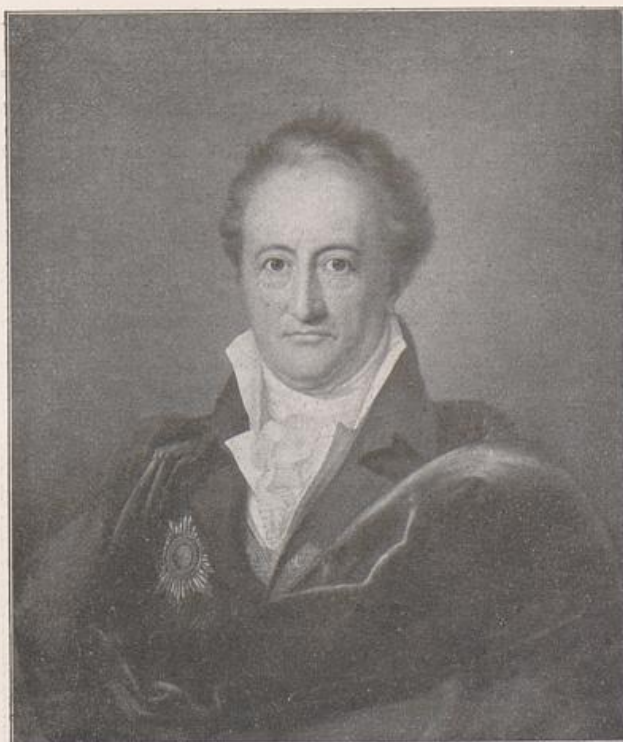
Abb. 19. Gerhard von Kügelgen, Goethe

viduell gerichteten Kunstgesinnung, wie die so aufgefaßte Romantik notwendig sein mußte, versteht sich von selber, daß diese Künstler in dem, was ihr Eigenstes vorstellt, Nachfolger und Schüler nicht wohl haben konnten, wenigstens nicht unmittelbare. Was Delacroix und Daumier für die Zukunft bedeuteten, wurde auf eine Weise fruchtbar, die das hier vorliegende Problem nicht berührt. Romantische Bildnismalerei, die als solche schöpferisch gewesen wäre, gibt es in Frankreich, außer bei Delacroix und Daumier, nicht, eine Schule etwa im Sinne der Ingres-Schule schloß sich an sie nicht an. Doch war die Kunstgesinnung, die in ihnen lebte, so stark und so allgemein in der Zeit begründet, daß sie sich auch auf dem Gebiete der Plastik wenigstens in einer großen Persönlichkeit äußert: in David d'Angers . Der war von Haus aus ein Klassizist, ein glühender Verehrer der Antike und antiker Formensprache. Wenn er trotz dieser Herkunft im Bildnis auf romantischen Wegen wandelt, wenn er aus Begeisterung für Goethe nach Weimar kommt und kurz vor dem Tode des Gewaltigen ihn noch in einem Medaillon und in einer Kolossalbüste modelliert und wenn er ihn dann, den Statthalter griechischen Geistes auf Erden, in