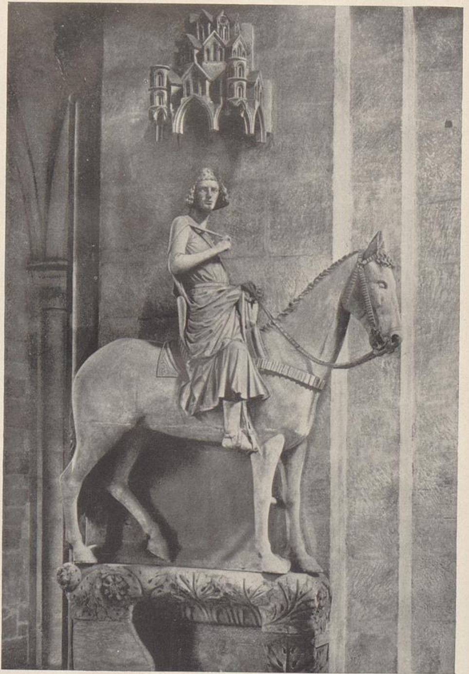
61. Der Bamberger Reiter