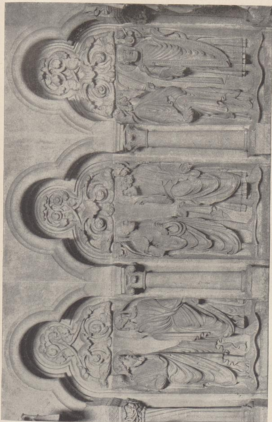
57. Georgenchor des Domes zu Bamberg. Nördliche Schranke. Ausschnitt