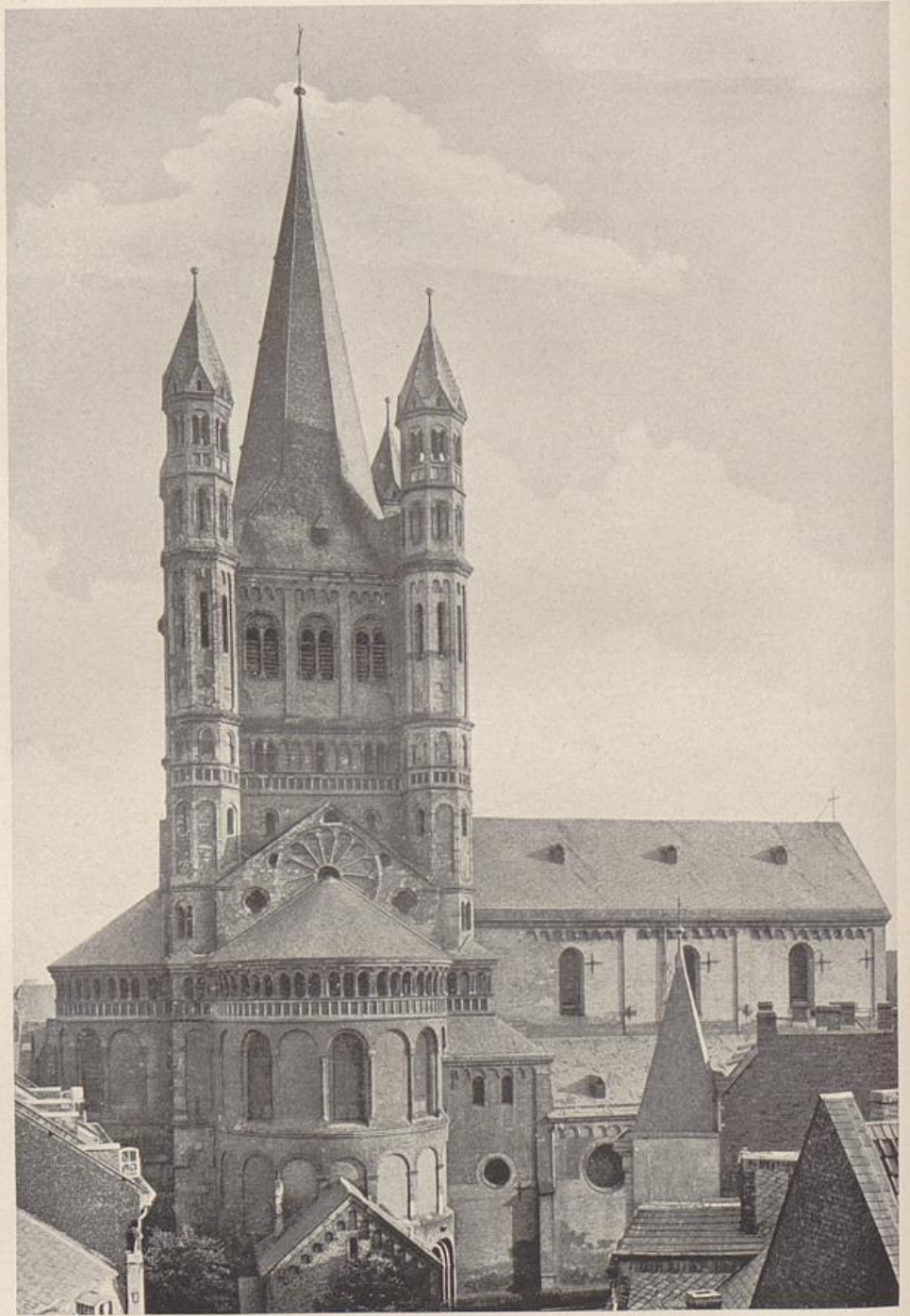
41. Köln, Groß-St. Martin