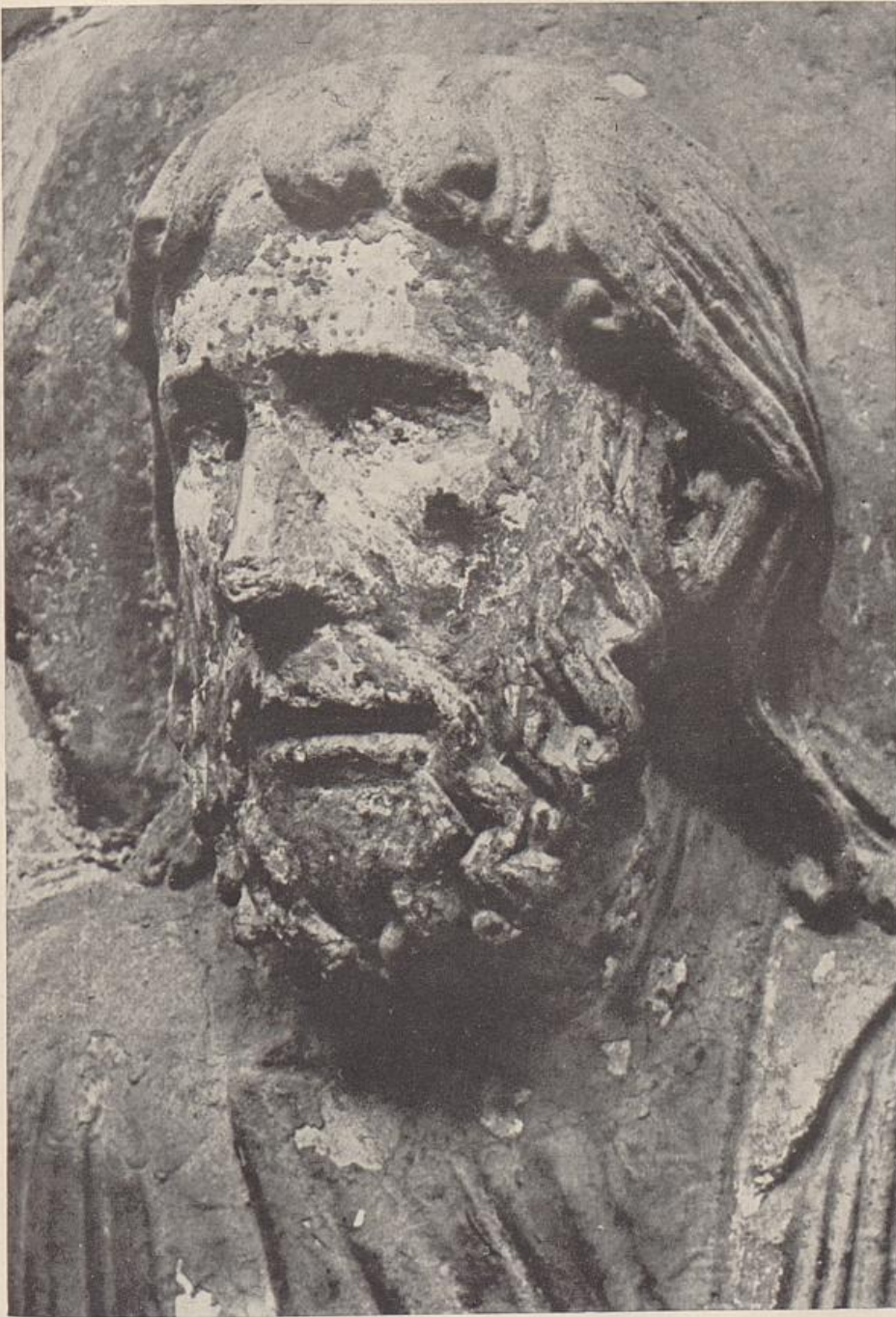
37. Kopf des Andreas an den Chorschranken der Liebfrauenkirche, Halberstadt