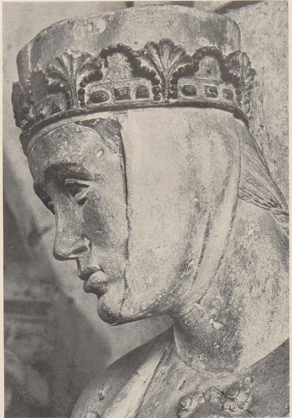
28. Kopf der Gerburg im Westchor des Domes zu Naumburg