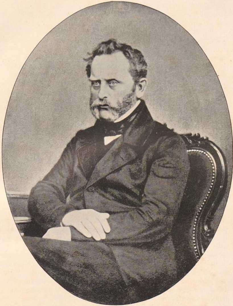
Joseph Ignaz Halberg