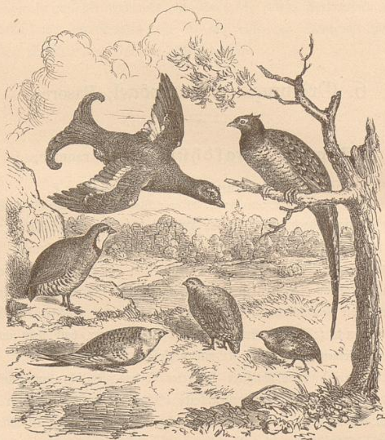
Hühnervögel (Birkhuhn, Steinhuhn, Fausthuhn, Rebhuhn, Wachtel, Fasan). (Fig. 21.)