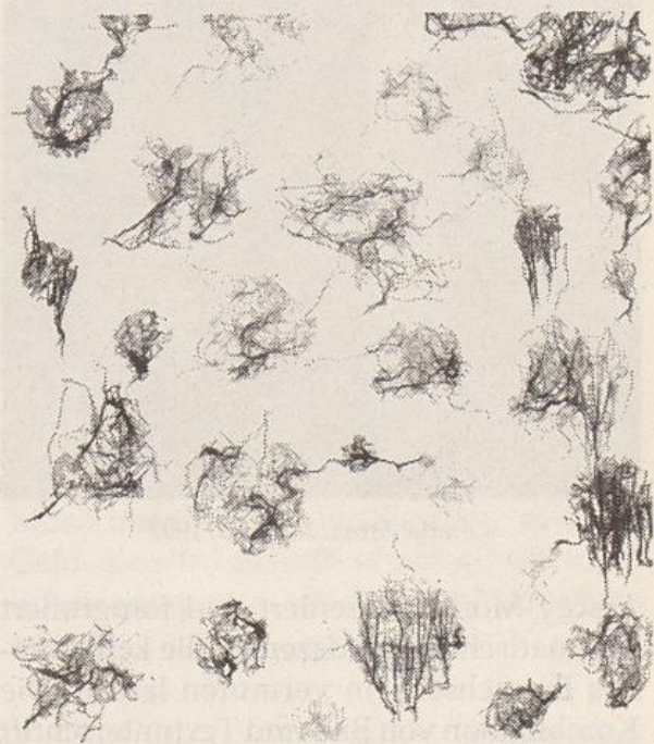
Ghada Amer: Untitled, 1993

und zweitens, daß hier Spontaneität mittels äußerst langwieriger und aufwendiger Technik suggeriert wird. Die Figuren, Frauen in obszönen Haltungen, werden rhythmisiert und ornamental eingesetzt, immer wieder nebeneinander aufgereiht. Durch die Serialität und die herabhängenden Fadenenden wird das Erkennen der Figuren erschwert und der Blick wechselt ständig zwischen Detail und Ganzem. Die obszönen