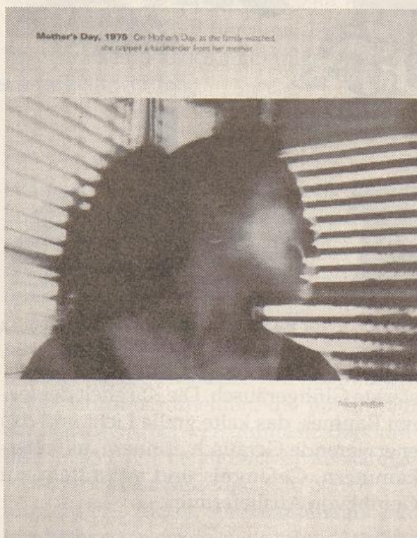
Tracey Moffatt: Mother's Day, 1975

wobei hier aber keineswegs rosige Zukunften suggeriert werden. (Sexuelle Gewalt, Einsamkeit, Unschuld sind die hier arrangierten Themen.