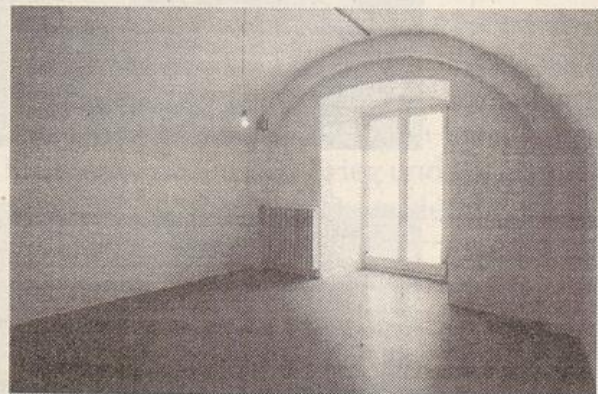
Mona Hatoum: in situ, 1998

Die Konzeptkünstlerin Ayse Erkmen aus Istanbul pflegt ihre Eingriffe in die Umgebung eher unauffällig vorzunehmen. Sie entwarf Computer-Bildschirmschoner, auf denen sich grüne Objekte lustig hüpfend oder trudelnd über eine Ebene bewegen. Bei diesen Objekten handelte es sich jedoch nicht um harmlose 'flying toasters', sondern um vier gängige Modelle von Landminen, jenen Mordinstrumenten, die überall auf der Welt Menschen verstümmeln. Die Computerinstallation befand sich im ausnahmsweise geöffneten Museumsbüro und dekontextualisierte diesen sonst zu alltäglichen, friedlichen Zwecken genutzten Arbeitsplatz.