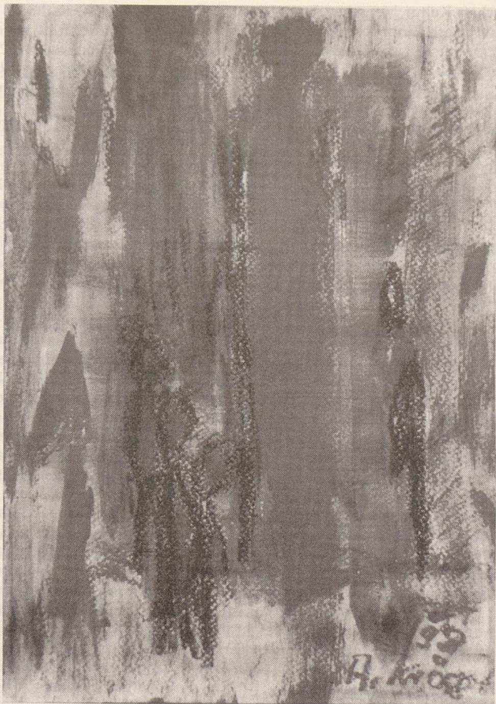
Anne Kröger: „Obdachlose“, 24x34 cm, Acrylfarben, Ölpastellkreiden

Das Bild „Obdachlose“, entstand in vielen Schichten im Jahr 1998.