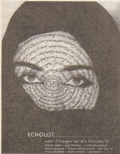
Plakat zur Ausstellung Echolot

schen Raum, der Türkei, aus Asien und Australien waren eingeladen, das Verhältnis der Kulturen und seiner wechselseitigen ästhetischen und politischen Beziehungen auszuloten. Ein gemeinsamer Nenner war, daß es sich um im europäischen Raum lebende Künstlerinnen handelt. Ihre Themen waren demzufolge nicht reine Präsentationen kulturell verschiedener Identitäten. Die Kunstwerke und Installationen drückten sich in der Bild- und Formensprache sowohl der Herkunftsländer, als auch des abendländischen Kreises aus. Ebenso vielsprachig und mehrkultural stellten sich die dezidiert politischen Themen dar. Verblüffend und aufregend war dabei die durchwegs kristalline Präzision von konzeptioneller und