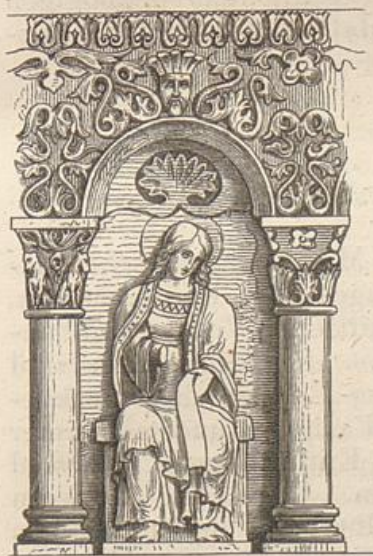
Arkadennische der Façade von Notre-Dame-la-Grand zu Poitiers. (Nach Willemin und de Laborde.)

Das vorzüglichst Eigenthümliche in der romanischen Architektur des Poitou betrifft die Ausstattung des Aeusseren. Die Façade von Notre-Dame-la-Grand 2 zu Poitiers bildet das Glanzstück jener phantastisch barocken Dekorativ-Architektur,