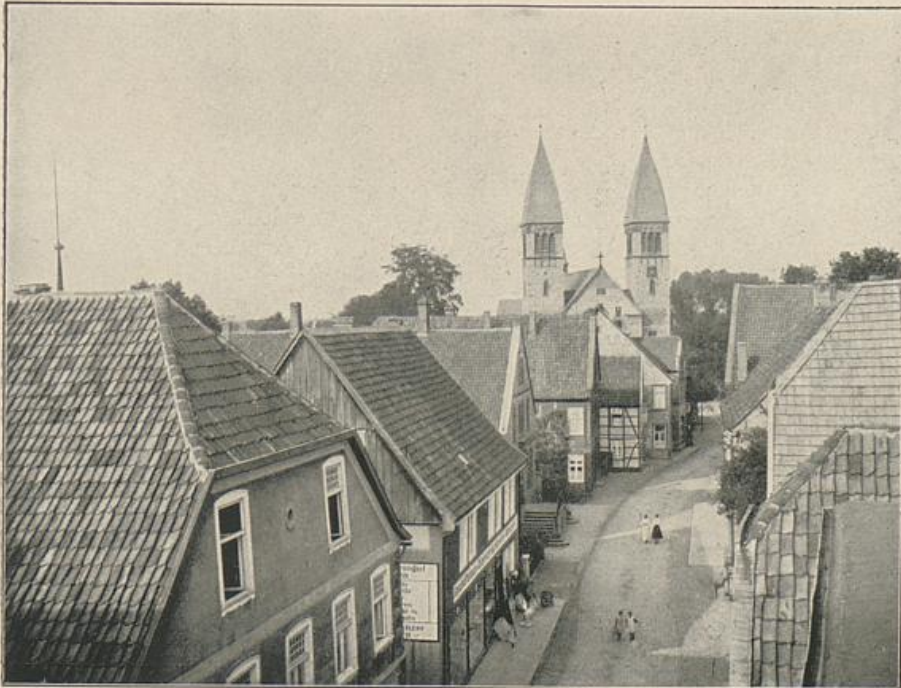
Partie aus Rheda.