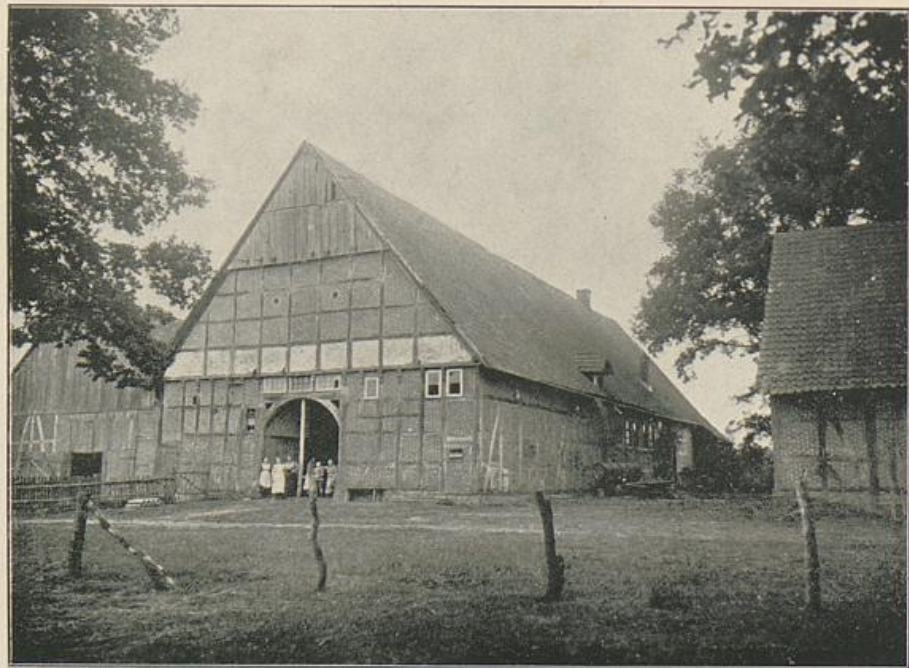
Möse. Niggemeier (früher Meierhof Haselhorst).