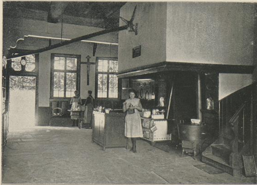
St. Vit. Küche von Meier Gewefenhorst.