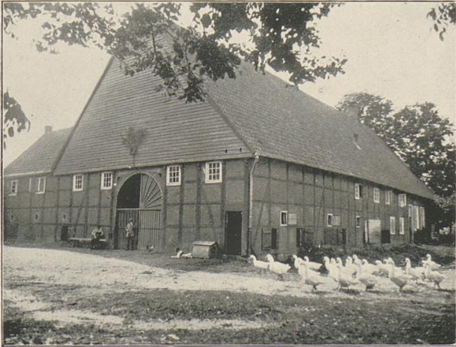
St. Vit. Meier Gewefenhorst.