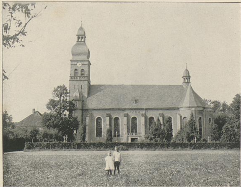
St. Vit. Pfarrkirche.