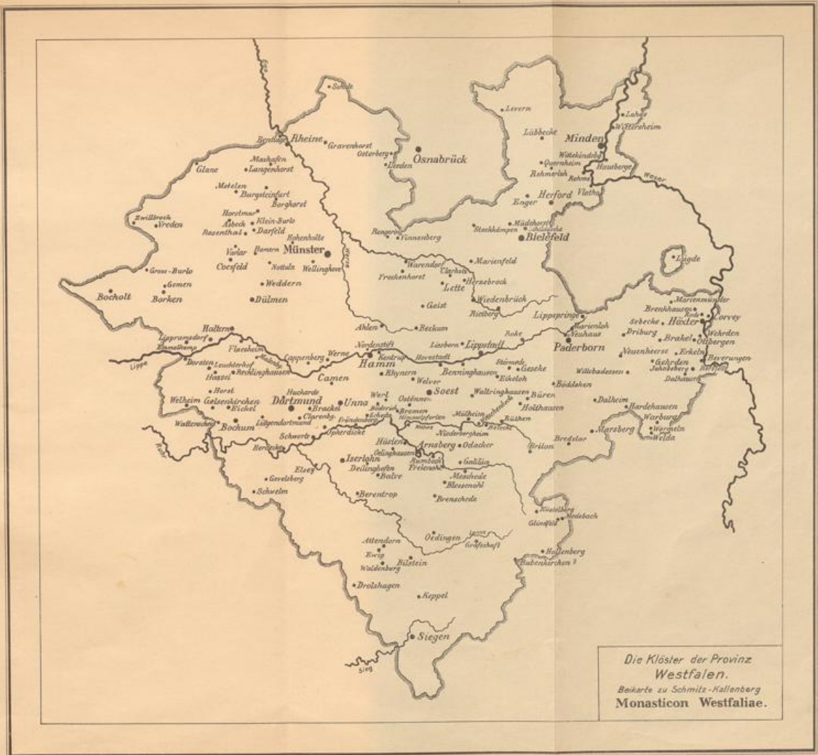
Die Klöster der Provinz Westfalen. Beikarte zu Schmitz-Kallenberg Monasticon Westfaliae.